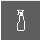
RENGJØRINGSMIDDEL GJERNE BIL-SHAMPO ELLER LIGNENDE