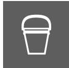
LUNKET VANN (MAX 35°C)