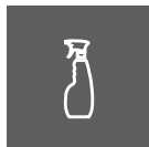
RENGJØRINGSMIDDEL MED PH-VERDI LAVERE ENN 7,5